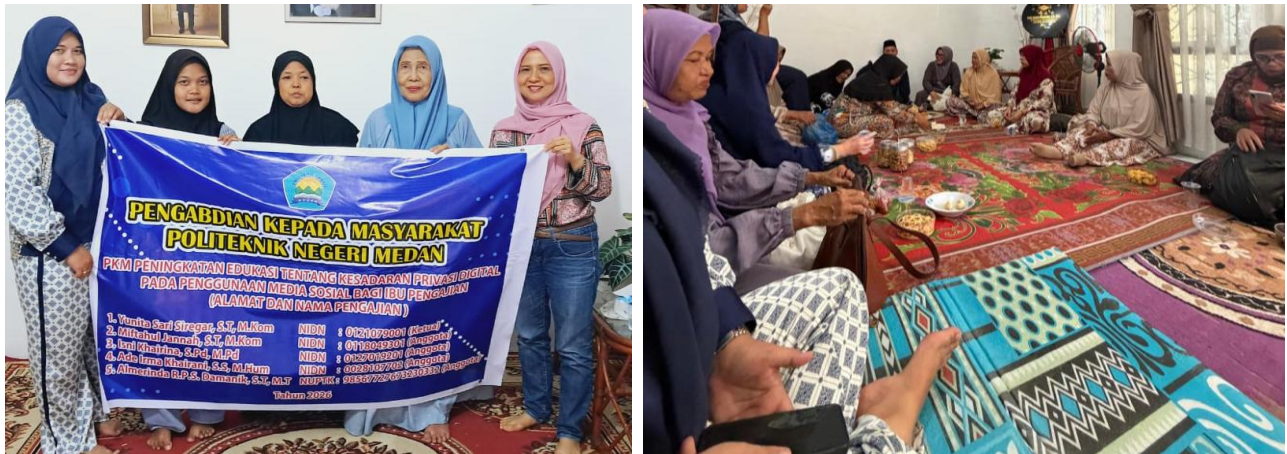
Gambar 2. Dokumentasi Pelaksanaan Kegiatan

Berdasarkan hasil pelaksanaan kegiatan, peserta menunjukkan respons yang positif terhadap materi yang diberikan. Hal ini terlihat dari antusiasme peserta dalam mengikuti penjelasan, mengajukan pertanyaan, dan berdiskusi mengenai pengalaman pribadi dalam menggunakan media sosial. Peserta mulai memahami bahwa penggunaan media sosial tidak hanya berkaitan dengan komunikasi, tetapi juga berkaitan dengan perlindungan data pribadi dan keamanan digital. Berikut adalah dokumentasi pelaksanaan Kegiatan